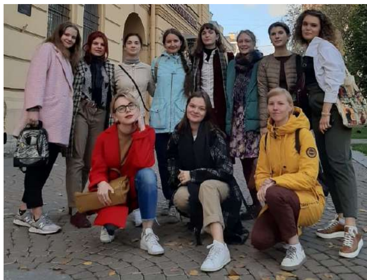
Волонтеры «Гуманитарного жеста» из России. Санкт-Петербург. Октябрь 2020