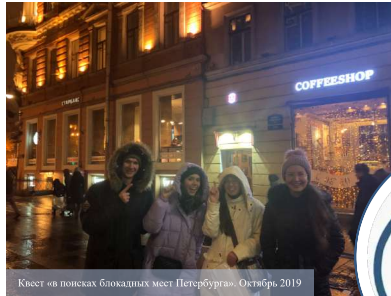
Квест «в поисках блокадных мест Петербурга». Октябрь 2019