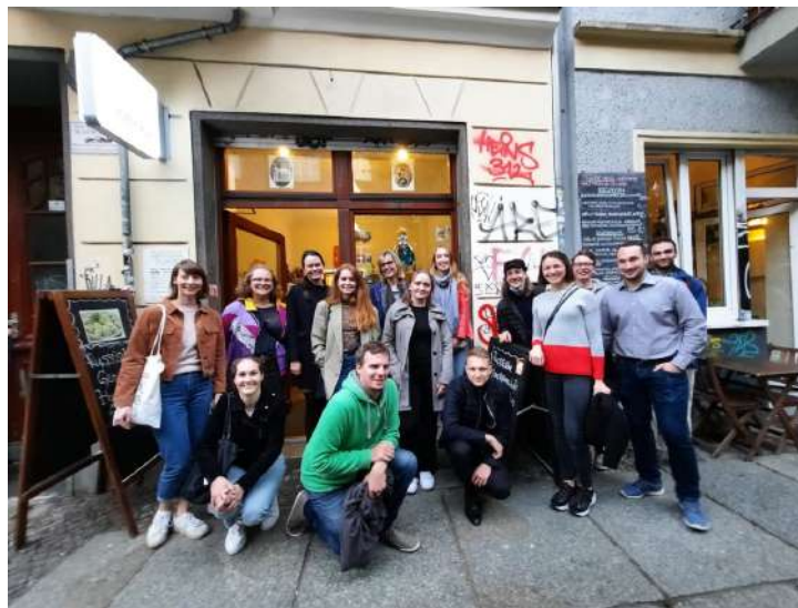
Волонтеры «Гуманитарного жеста» из Германии. Берлин. Октябрь 2020

Участники распрощались с проектом под католическое рождество, дружно распаковав свои новогодние подарки. Что можно сказать? Да, это были непростые три месяца, напряженные, требующие полной вовлеченности и самоотдачи. Но в то же время, это были незабываемые месяцы удивительных и ярких эмоций, оставивших глубокий след в нашем сознании. И теперь, когда все позади, можно с гордостью сказать: «Wir haben es geschafft! И до новых встреч!»