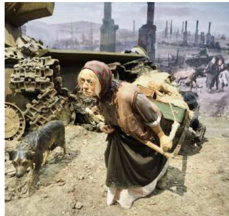
Посещение участниками проекта панорамы «Память говорит. Дорога через войну» Санкт-Петербург. Октябрь 2020